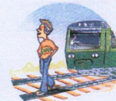
Слушать плеер и говорить по телефону вблизи железной дороги.