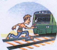
Перебегать пути перед поездом.

Слушать плеер и говорить по телефону, т. к. можно не услышать сигналы приближающегося поезда и объявления диктора.