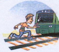
Перебегать пути перед поездом.

Слушать плеер и говорить по телефону, т. к. можно не услышать сигналы приближающегося поезда и объявления диктора.