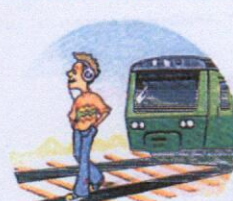
Слушать плеер и говорить по телефону вблизи железной дороги.