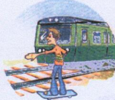
Кататься вблизи железной дороги.