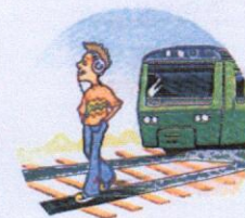
Слушать плеер и говорить по телефону вблизи железной дороги.