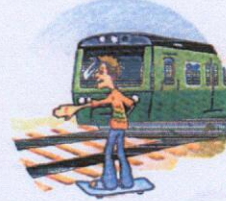
Кататься вблизи железной дороги.