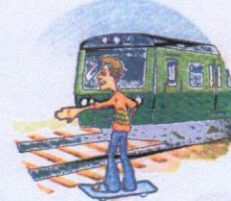
Кататься вблизи железной дороги.