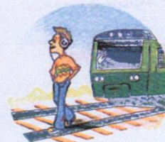
Слушать плеер и говорить по телефону вблизи железной дороги.